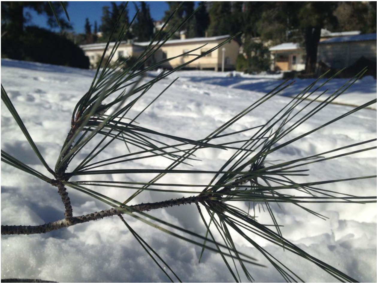
מבט פנורמי מהבטונדות