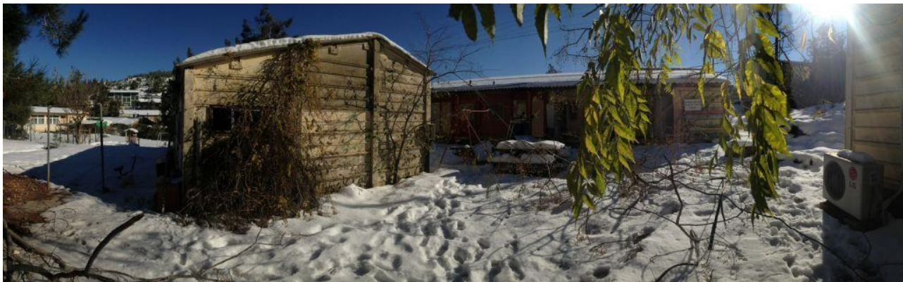
ועוד קצת תמונות משלי :