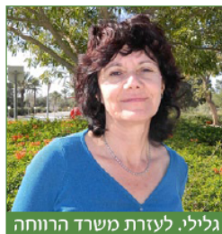
גלילי, לעזרת משרד הרווחה

הצעת סיוע לבעלי צרכים מיוחדים: עבור מימון ציוד רפואי או טיפולים. המרכז לייעוץ ושיקום של התנועות הקיבוציות שהוא חברה בע"מ ונמצא בהרצליה מציע סיוע כספי עד 4,000 ש"ח לחברי קיבוצים עם צרכים מיוחדים. הכתובת למשלוח פניות: המרכז לייעוץ ושיקום, רחבן גוריון 33, בית אלבה קומה 4, הרצליה, מיקוד 46785 . טלפון לפרטים 09-9513554 .