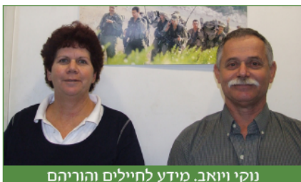
נוקי ויואב. מידע לחיילים והוריהם

מלפיד הייתה להתערב בנושא עצירת הבנייה בקיבוצים, כחלק מהיעדים הלאומיים עליהם הוא מופקד, בעזרה לקדם את מסלול שיוך הדירות הנוסף שצפוי להיות מוצע על ידי משרד השיכון ורשות מקרקעי ישראל, ולהציג לשר את עמדות התנועה בנושא לפני חתימתו על החלטות מועצת מקרקעי ישראל בנושאים הנוגעים לקיבוצים. לפיד הבטיח שיעמוד אתנו בקשר בנושא הזה.